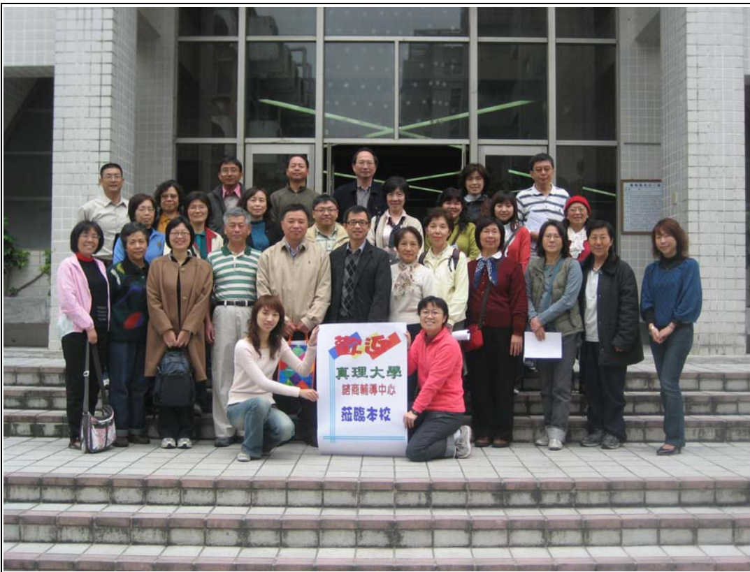
日期：98.01.19 內容摘要：真理大學學生諮商輔導組與本校學生諮商組人員全體合照