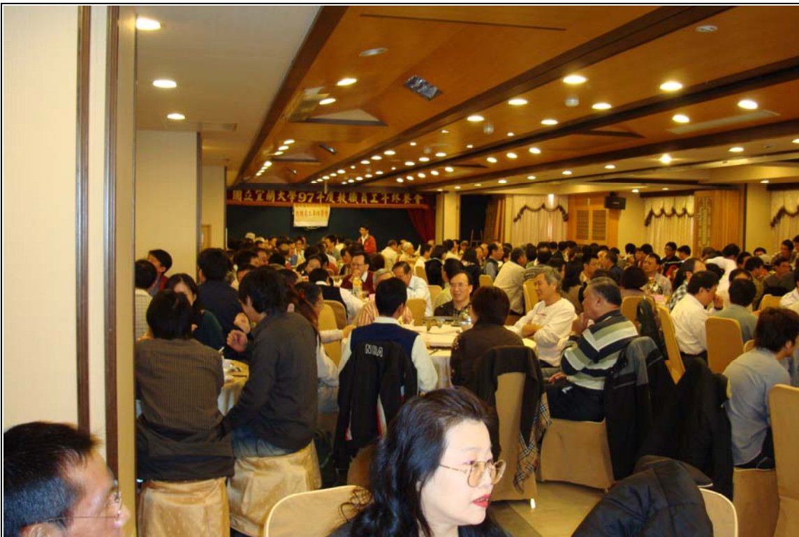
日期：97.12.17 內容摘要：97年年終尾牙餐會