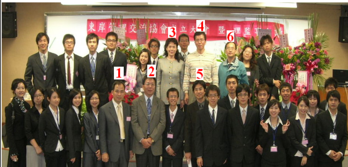
日期：97.12.20 內容摘要：東岸管理交流協會_成立大會