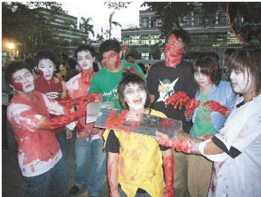
日期：97.12.10~12.11 內容摘要：系學會舉辦「大宅怨」鬼屋試膽宣傳活動