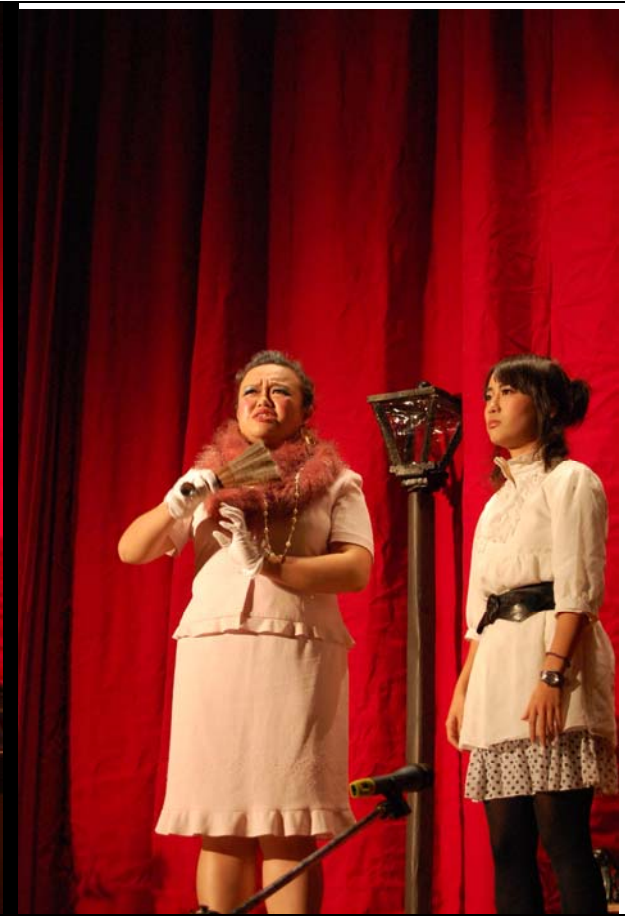
日期： 97.12.26-27 內容摘要：外文系 97 年首屆畢業公演-公演實況