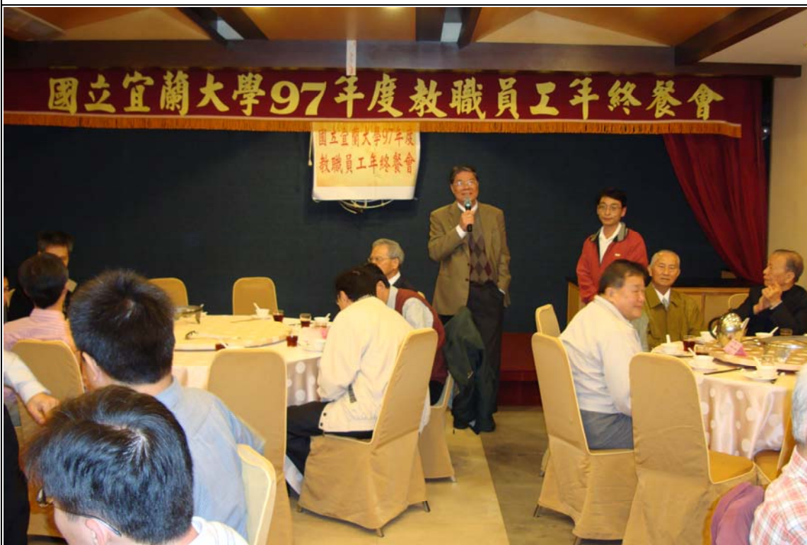
日期：97.12.17 內容摘要：97年年終尾牙餐會