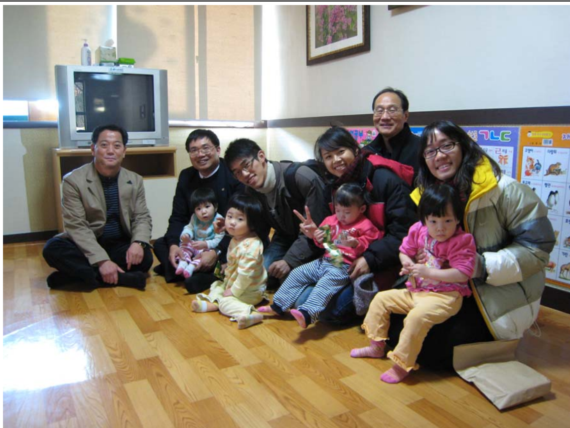
日期：97.12.4-6 地點：韓國原州 內容摘要：2008 國際志工韓國原州關懷活動