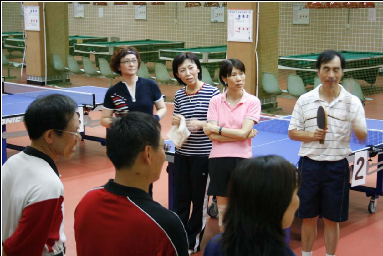
日期：96.06.15(五) 內容摘要：總統府桌球社友誼賽