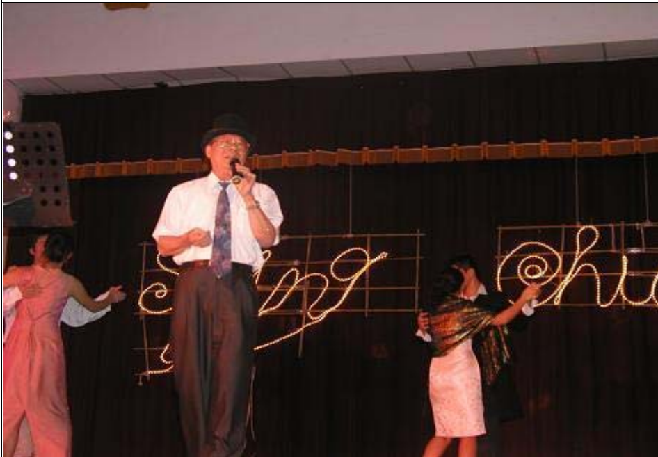
日期：96.6.6 內容摘要：「社團薪傳獎」校長高歌一曲榕樹下