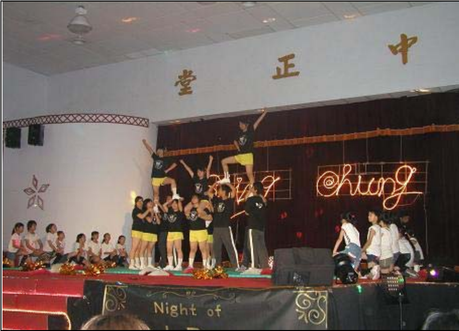
日期：96.6.6 內容摘要：「社團薪傳獎」同樂國小與本校競技啦啦隊同台演出