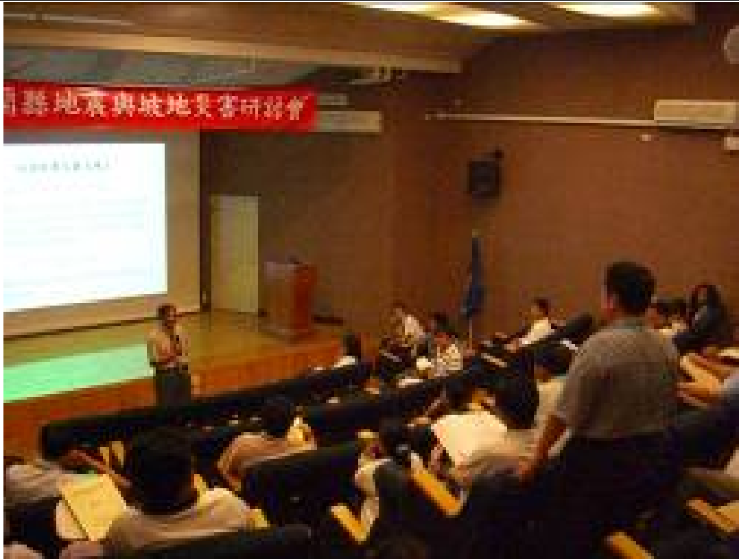
日期：96.07.18 內容摘要：工學院辦理宜蘭縣地震與坡地災害研討會