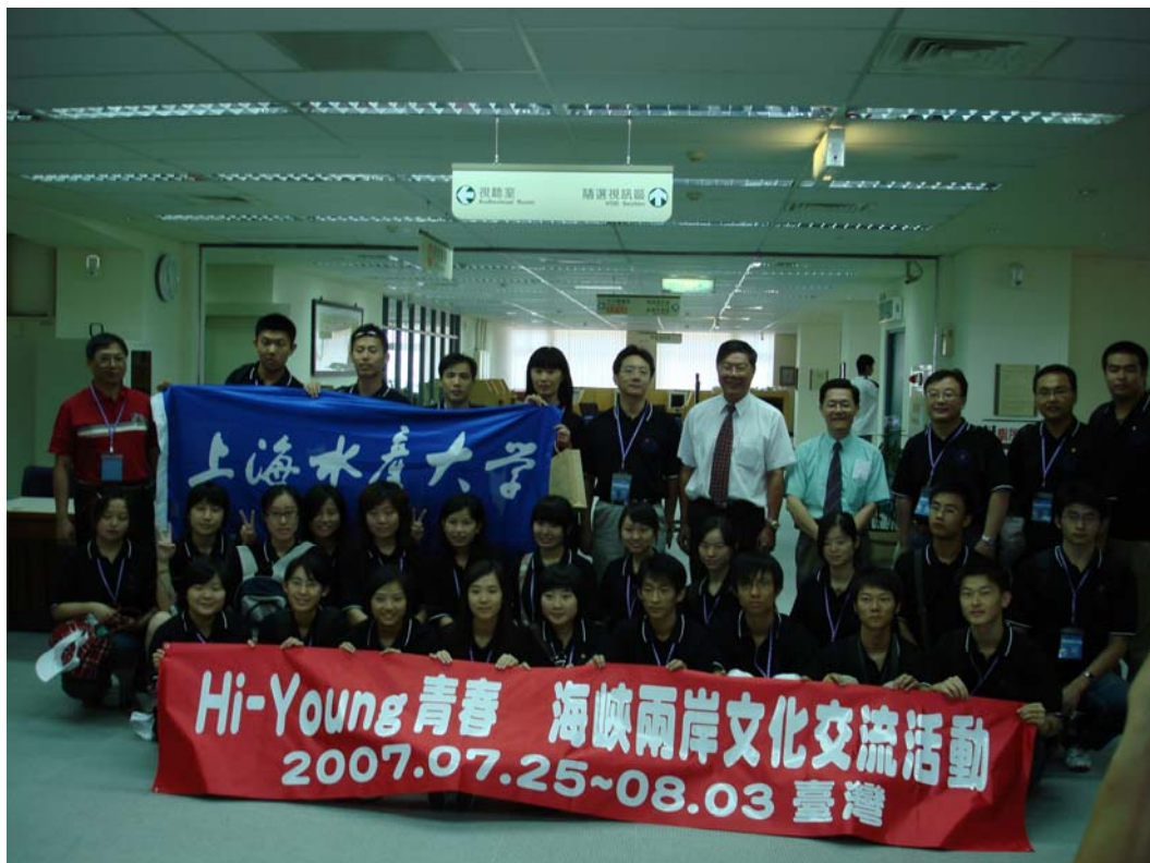
日期：96.07.27 內容摘要：國立臺灣海洋大學、國立高雄海洋科技大學、上海水產大學及中國海洋大學等校之「Hi-Young 青春」兩岸海洋文化探索交流活動73名師生於7月27日蒞校參訪。