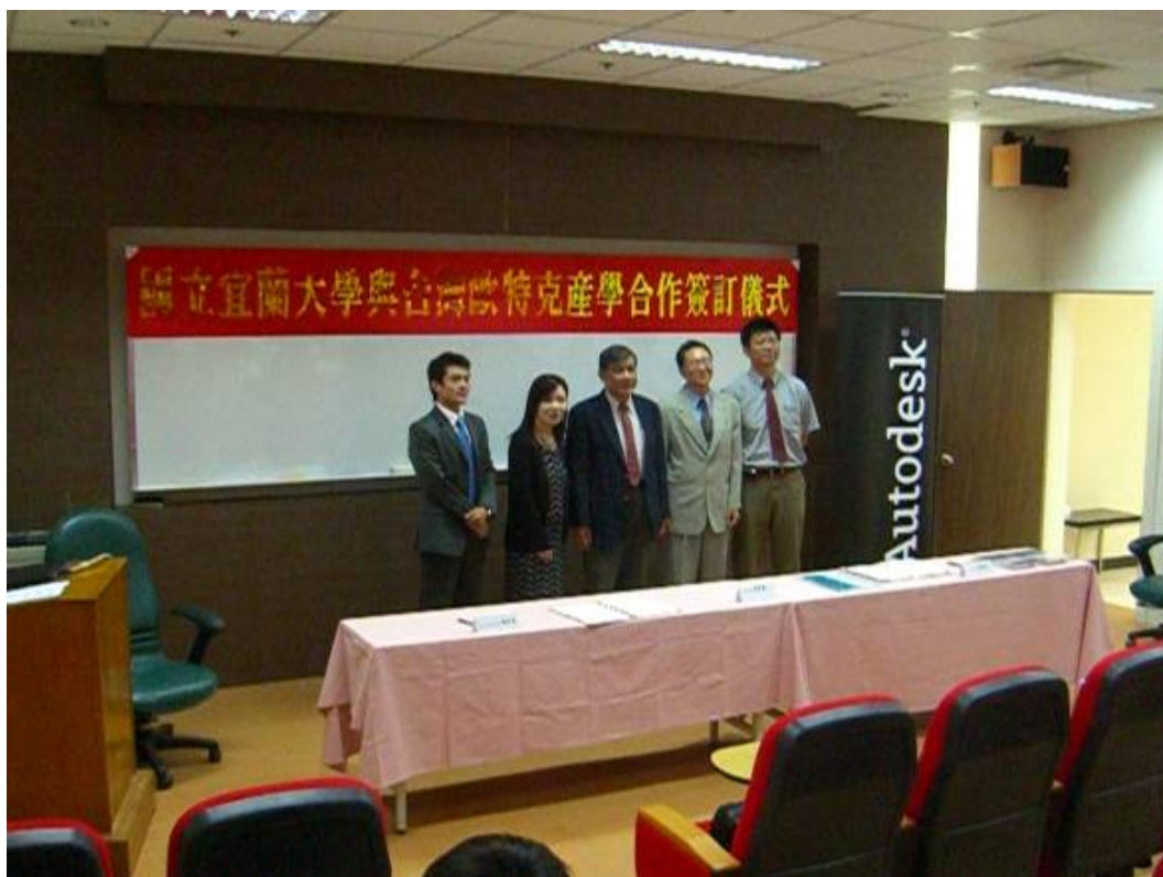
日期：7月27日 內容摘要：與 AUTO DESK 簽建教合作意願書（照片 8）