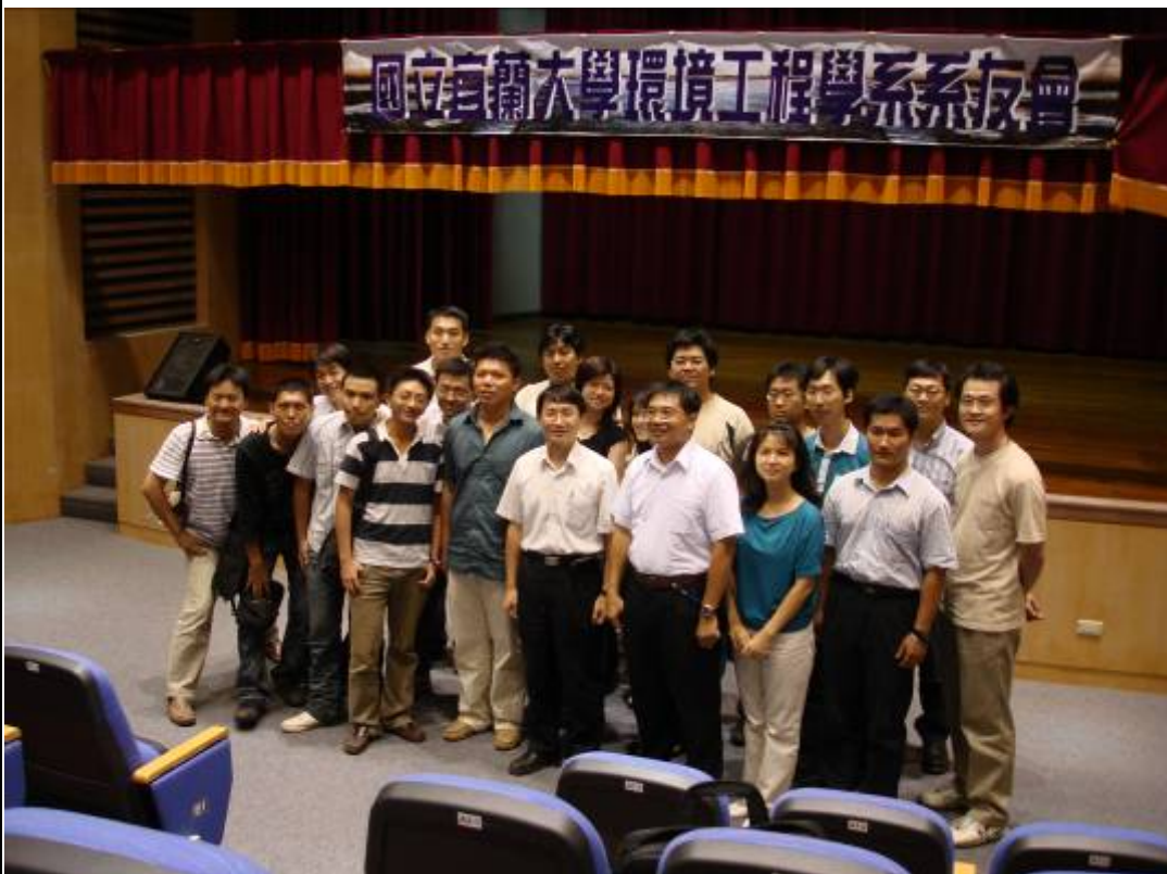
日期：96.7.21 內容摘要：環境工程學系系友會成立大會