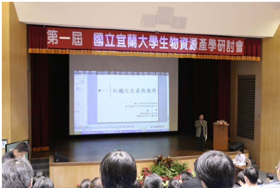
No.15 日期：94.12.2 地點：本校圖書資訊館國際會議廳 內容摘要：生物資源學院辦理「第一屆國立宜蘭大學生物資源產學研討會」演講現場。