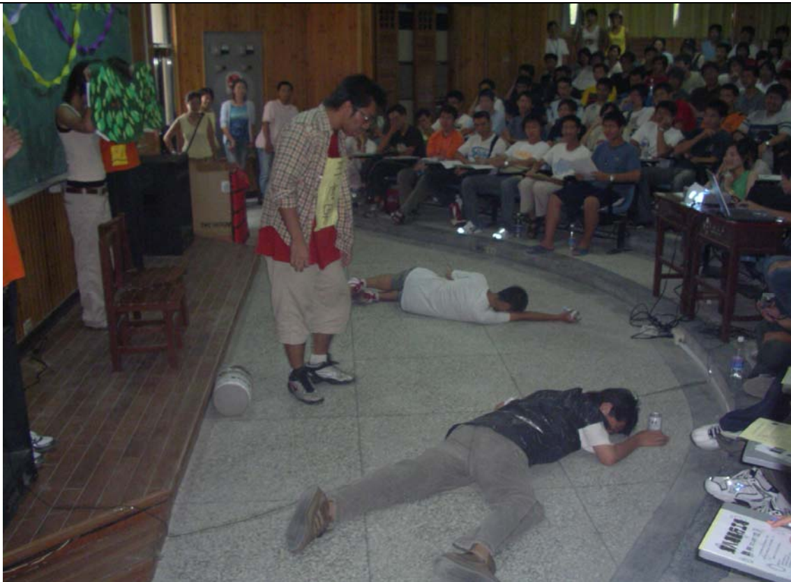
No.7 日期：94.9.9 地點：人文管理學院階梯教室 內容摘要：學生諮商組--新生入學輔導「命運你我他」新生話劇