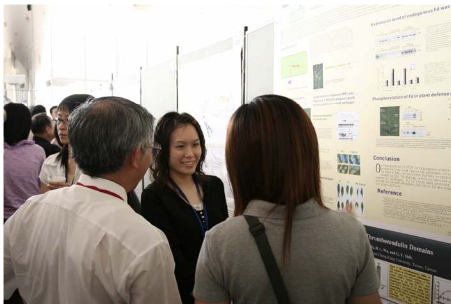
No.2 日期：94.9.8~9 地點：教稽大樓國際會議廳、交誼廳 內容摘要：生物資源學院與台灣生化與分子生物學會合辦「台灣生化與分子生物學年會--94-宜蘭夏令營」全國性學術研討會，會場之壁報展示評獎。