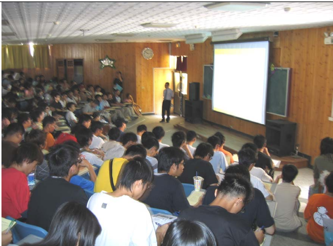
No. 5 日期：94.9.9 地點：人文管理學院階梯教室 內容摘要：衛生保健組--新生健康宣導（觀賞投影片情形）