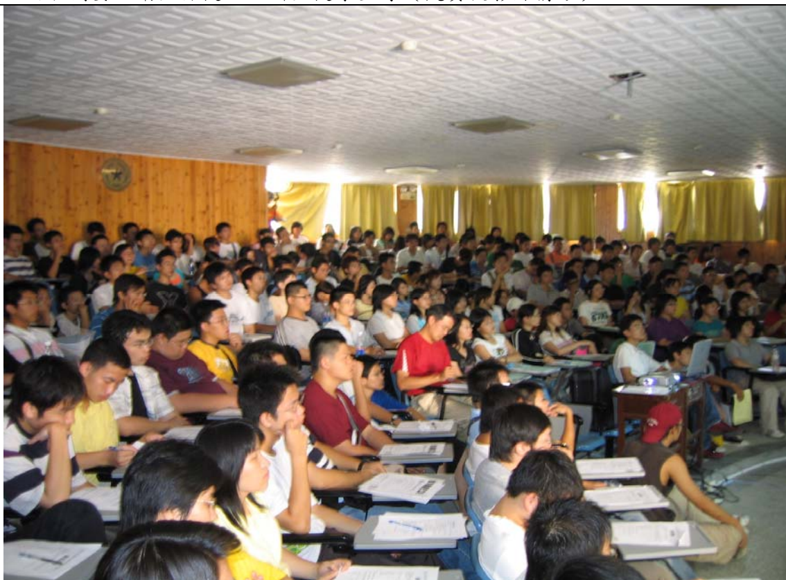
No. 6 日期：94.9.9 地點：人文管理學院階梯教室 內容摘要：衛生保健組--新生健康宣導（一共五梯，每梯五個新生班）