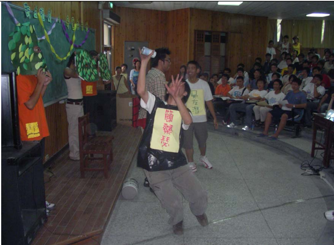
No.4 日期：94.9.9 地點：人文管理學院階梯教室 內容摘要：學生諮商組--新生入學輔導「命運你我他」新生話劇