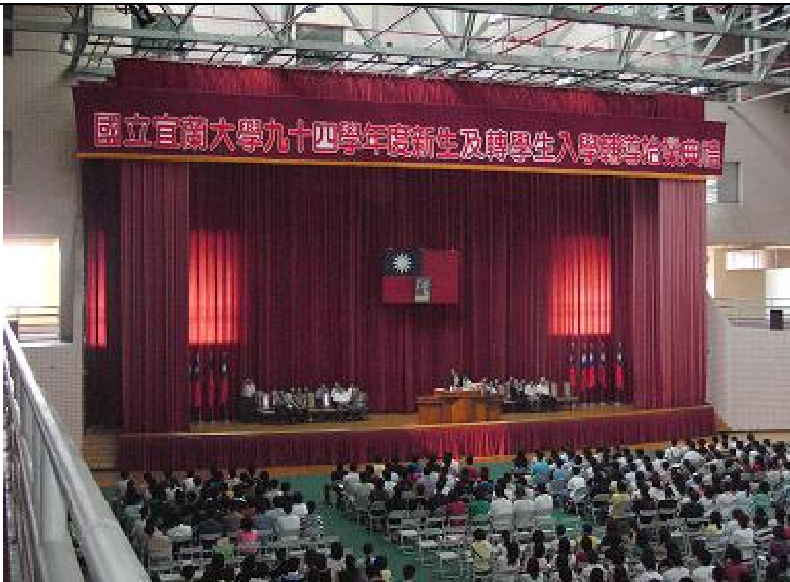
No.3 日期：94.9.9 地點：體育館二樓籃球場 內容摘要：課外活動組--九十四學年度新生及轉學生入學輔導始業典禮