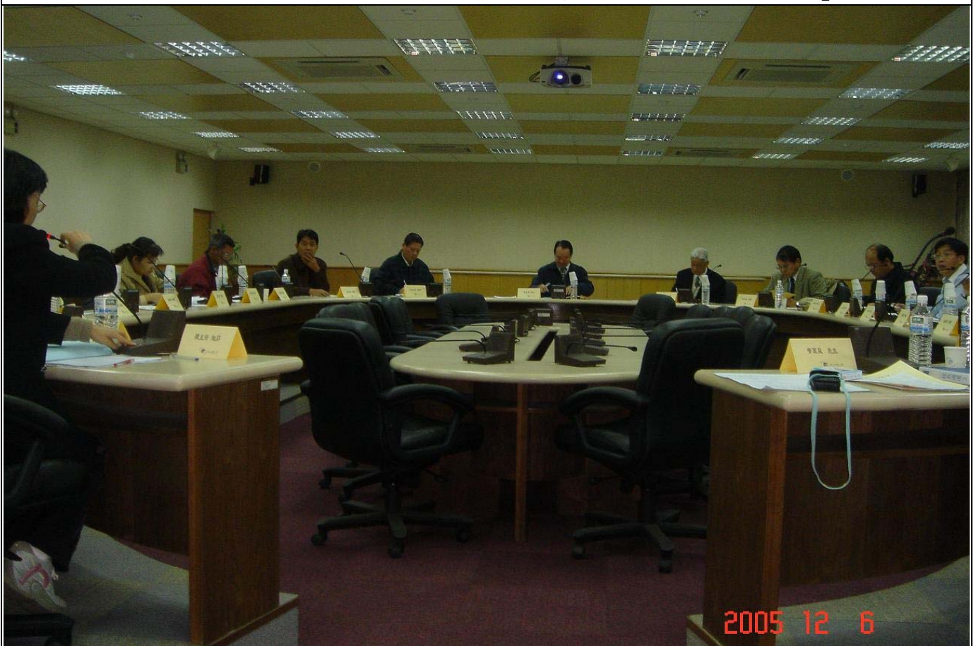
No.16 日期：94.12.06 內容摘要：召開本校第二任校長遴選委員會第一次委員會議