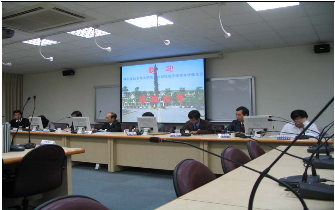
No. 25 日期：94.12.20 內容摘要：教育部環保小組蒞校實施校園環境評鑑簡報。