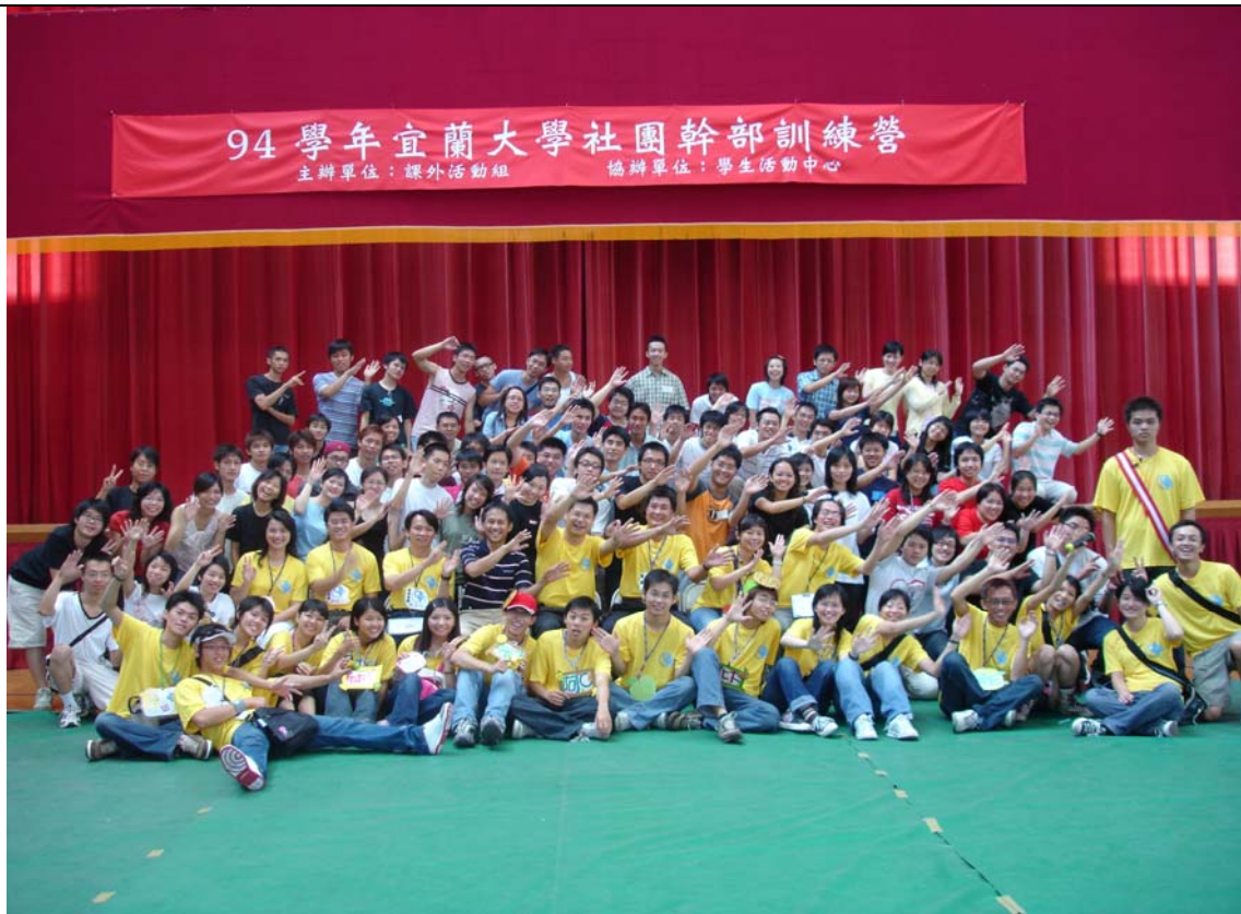
No.1 日期：94.9.6~8 地點：體育館二樓籃球場 內容摘要：課外活動組--九十四學年度社團幹部訓練營團體合照