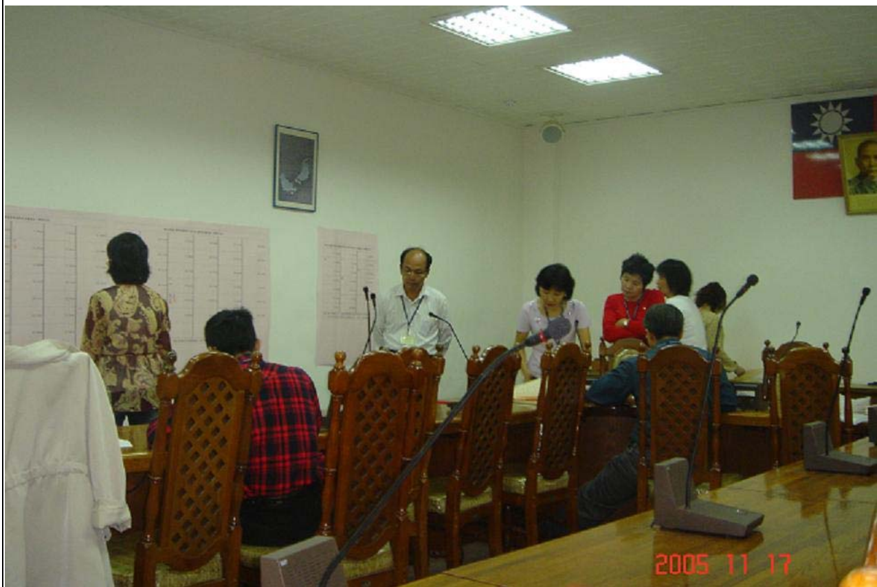
No.13 日期：94.11.17 內容摘要：辦理本校第二任校長遴選委員會委員選舉