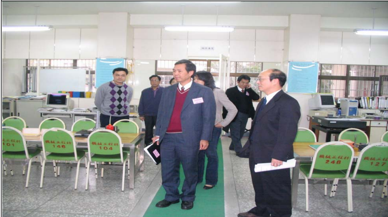
No. 26 日期：94.12.20 內容摘要：教育部環保小組實驗室現場勘查。