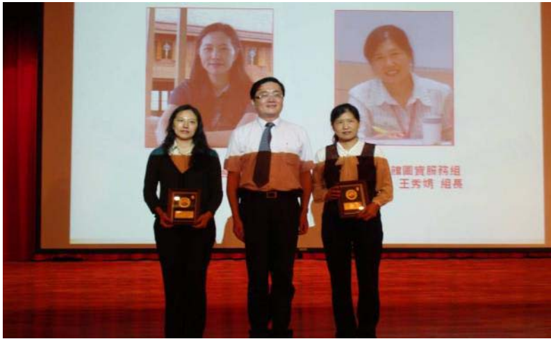
內容摘要：表揚晉升簡任官等訓練合格人員

慶祝教師節，於教師節茶會上表揚「績優研究教師」、「優良教師」、「晉升簡任官等訓練合格人員」。