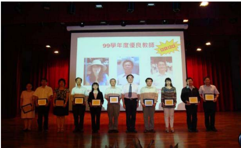
內容摘要：表揚優良教師